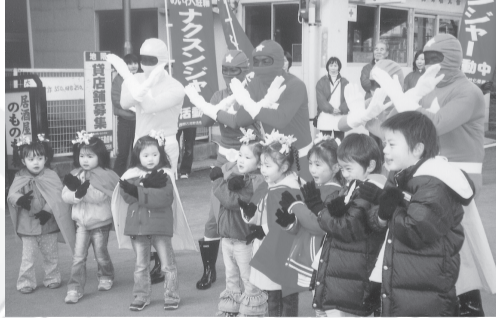
チビナクスンジャーと共に迷惑駐輪に喝っ!

最近、JR西明石駅の南側ロータリーが改装され美しくなっただけでなく、迷惑駐輪が少なくなり、眺めがすっきりとした。二〇〇四年十二月にナクスンジャーが初出勤してから早一年半が過ぎた。西明石に住む人なら、胸にある星のマークを輝かせ、さっそうと練り歩く五人の戦士を一度は見かけているのではないだろうか？実は、このロータリーに生みの親は男・三好宏なのである。