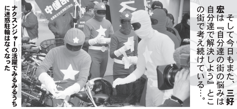
ナクスンジャーの活躍をみるみるうちに迷惑駐輪はなくなった